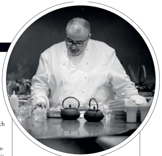
Santi Santamaria war 1994 der erste Katalane, der drei Sterne erhielt. Sein Credo: »Einfaches gut zubereiten.« Im Februar 2011 starb er 54-jährig in Singapur

Für Sven Elverfeld ist das schwer zu beantworten: »Das ›Signature Dish‹ kristallisiert sich erst nach Monaten heraus. Ich entscheide ja nicht darüber, es geht doch ausschließlich um die Akzeptanz der Gäste. Wenn von 1000 Gästen 999 sagen, das ist das Gericht, das am meis-