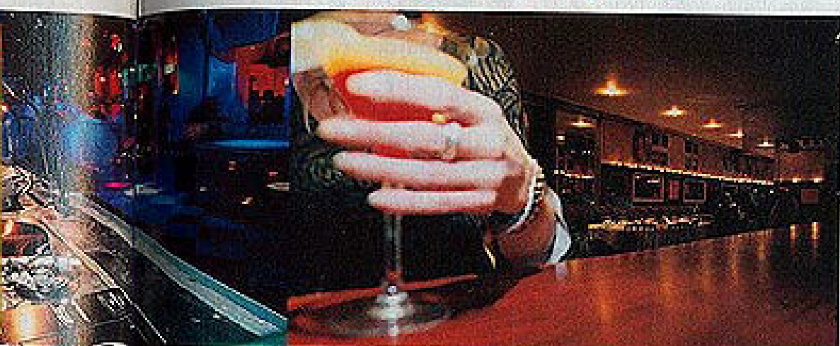
Le premier étage des Bains. Parce qu'on vous traite comme un VIP.