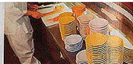
Lô Sushi, renoncez ! 460 F pour deux. Cherot, pour les japonaiseries.