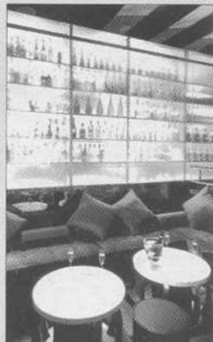
↑喝酒是一件很麻烦的事,但也很好玩。